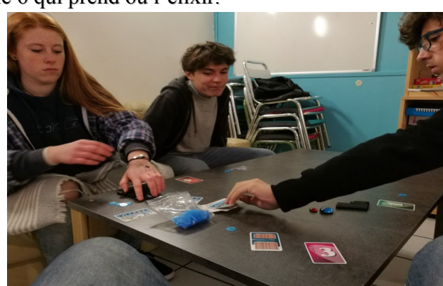
Monts : Mardi, Jeudi, Vendredi (17h-19h) Mercredi et Samedi (14h-19h)

Ces après-midis conviviaux continuent souvent autour de différents jeux de sociétés, opposition aux échecs pour certains et des jeux à plusieurs plus légers pour les autres. Découverte ces dernières semaines : le Kiproko, le 6 qui prend ou l'élixir.