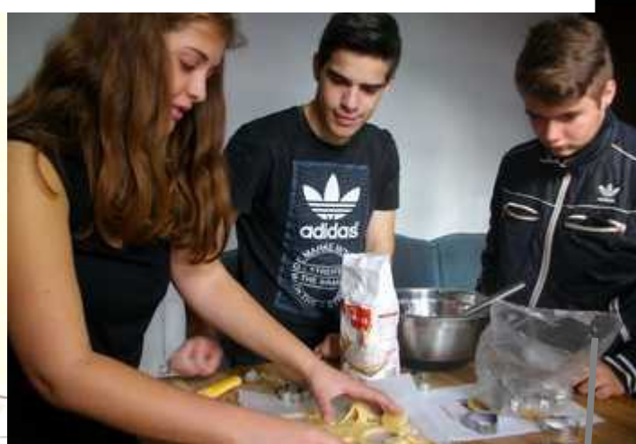
Truyes : Mardi, Jeudi, Vendredi (17h-19h) Mercredi et Samedi (14h-19h)

Ce sont les ateliers de cuisine qui ont été mis à l'honneur, avec un objectif bien défini : « un jour, un gâteau » ! Aussitôt dit, aussitôt fait : ce sont donc de succulents muffins au nutella, petits sablés au miel, tarte à la confiture et gâteau roulé qui ont été confectionnés ! Et malgré une pâte à tarte qui n'a pas vraiment eu l'aspect escompté le 3e jour, nos jeunes truïcien(ne)s ne se sont pas laissés abattre et ont proposé une revisite de ce dessert.